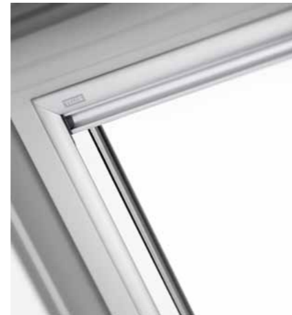
Les profils en aluminium ultraminces utilisés pour les produits de protection solaire manuels sont non seulement esthétiques, mais laissent également entrer davantage de lumière dans la pièce à volets ouverts.