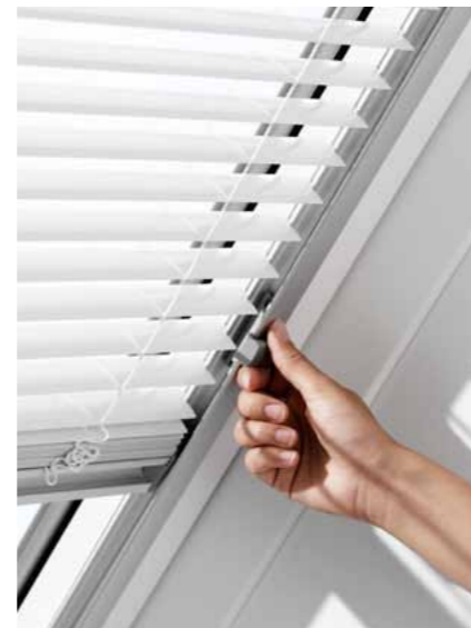
Grâce au design unique en son genre, vous pouvez réguler aisément la direction de l'entrée de lumière grâce à l'orientation des lamelles.